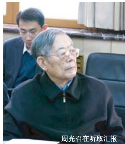
周光召在听取汇报

周光召名誉主席高度评价了973项目取得的成就, 并称赞项目组在产、学、研结合方面走出了一条道路。他还强调了钢铁材料基础研究的重要性,